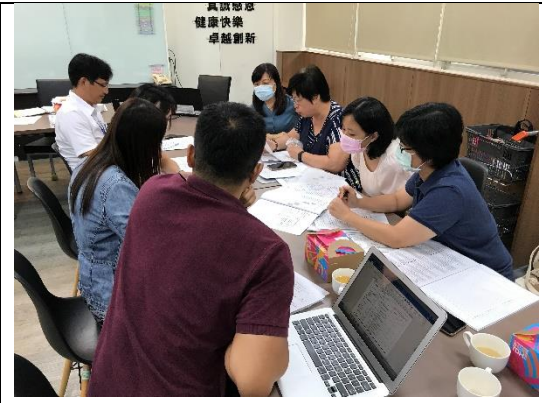
前導核心學校工作討論