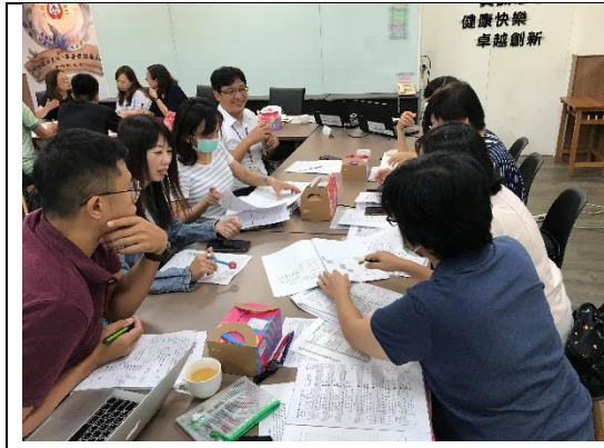
前導核心學校工作討論