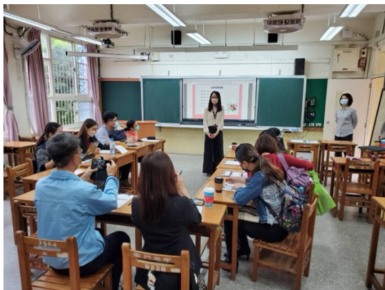
1. 公開授課教師進行說課