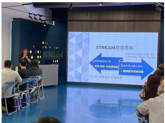
靜心高中圖資組林逸萍組長數位觀議課分享 主題：STREAM 跨境專案