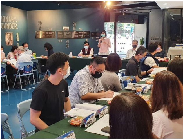
文山區蔡實督學蒞臨指導