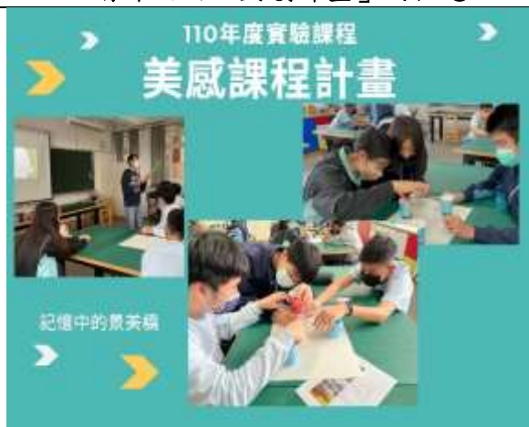
▲學生課堂實作分享