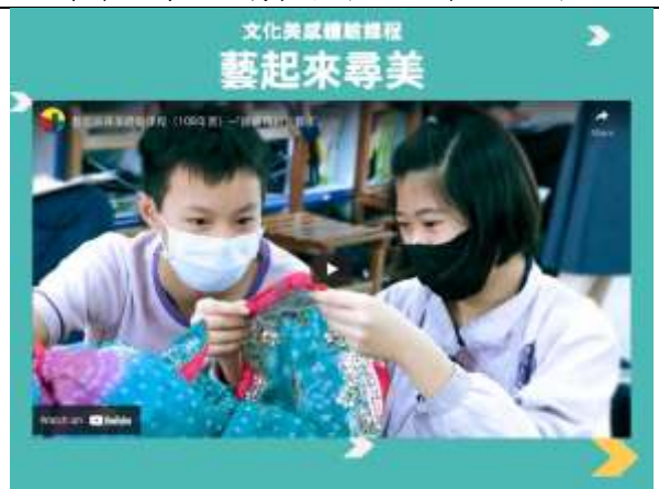
▲講師分享「文化美感體驗課程」