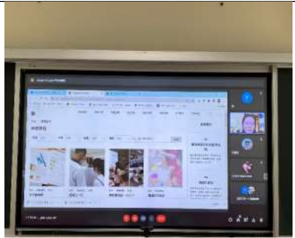
▲講師分享美感實作課程與學生上課概況