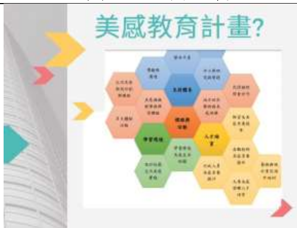
▲講師說明「美感計畫」的概念