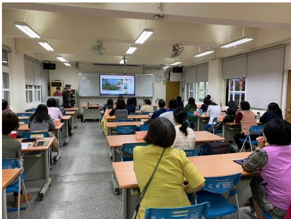
本土語教育師資及專業增能-八音傳情，布農迴盪