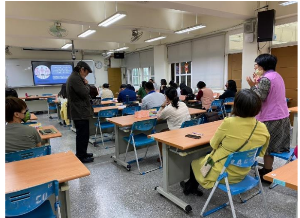
增能研習-與講師互動