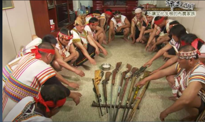
Pislai(祈求) 求滿揆獵物歸來