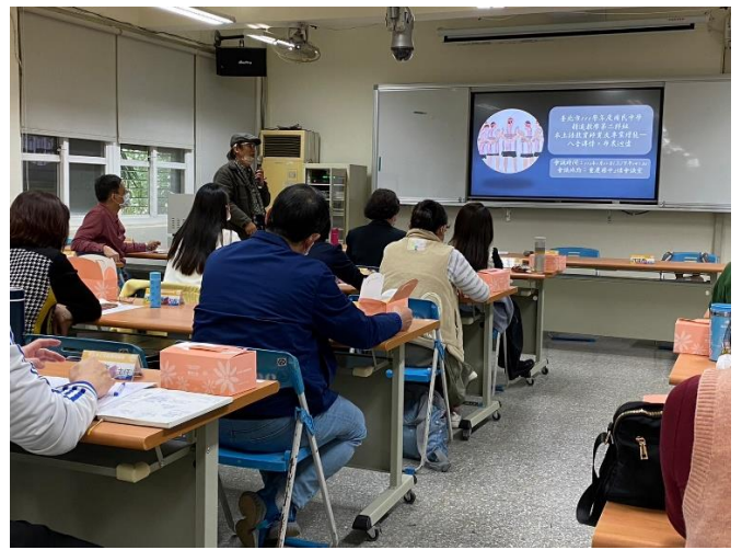
本土語教育師資及專業增能-八音傳情，布農迴盪