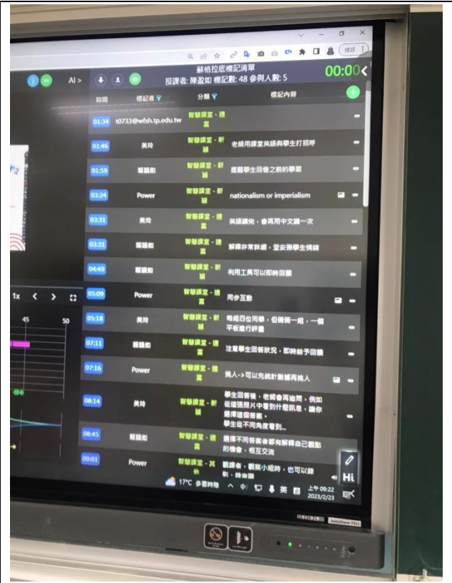
利用蘇格拉底觀課軟體進行觀課之觀課紀錄