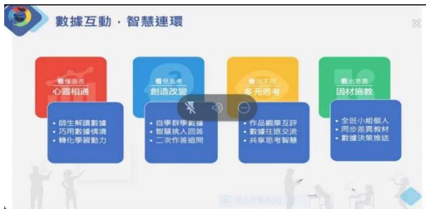
醍摩豆全球教育研究院吳權威院長介紹 AI 智慧教學效益