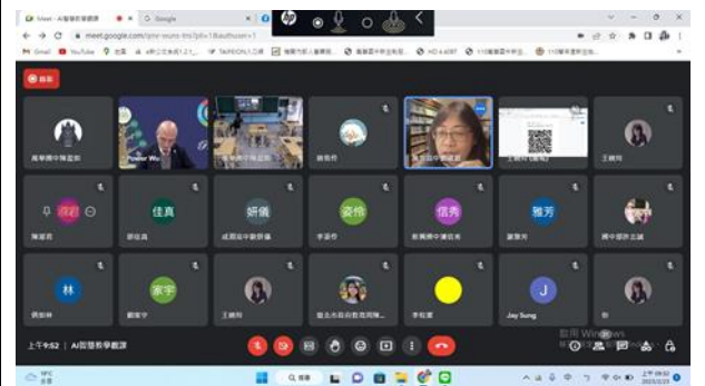
主辦學校萬芳高中校長致詞