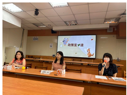
陳○君課督進行政策宣達。