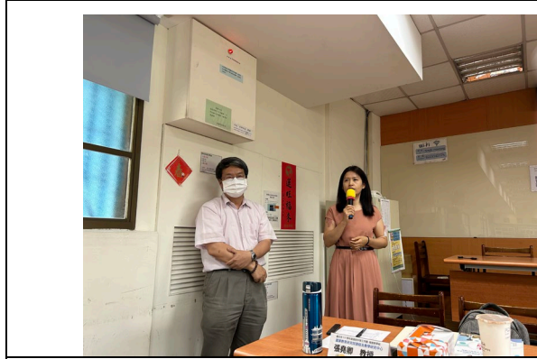
林○聿主任開場致詞。