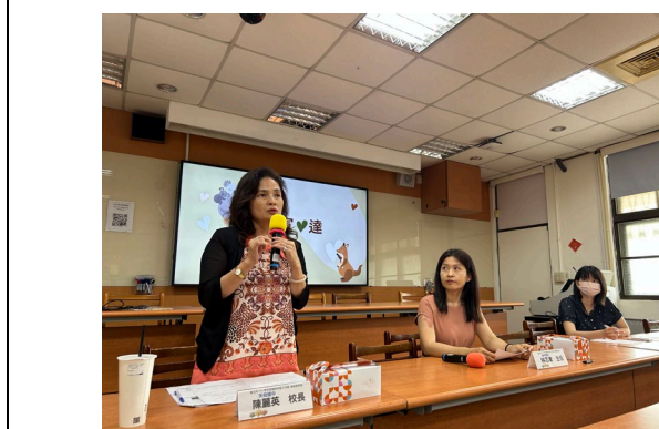
陳○英校長工作圈業務宣達。