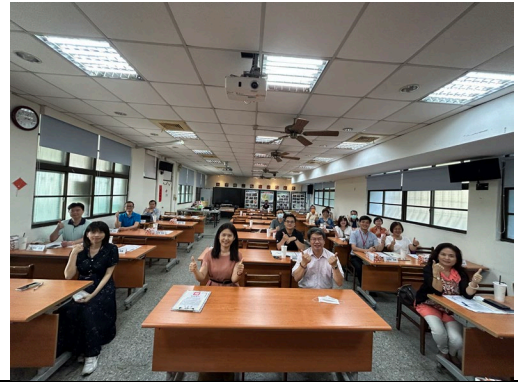
會後大合照合影留念。