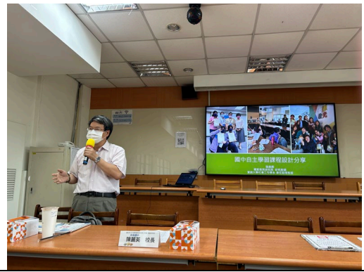
張○卿教授專題講座分享。