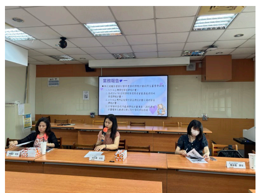
林○聿主任業務報告與議案討論。