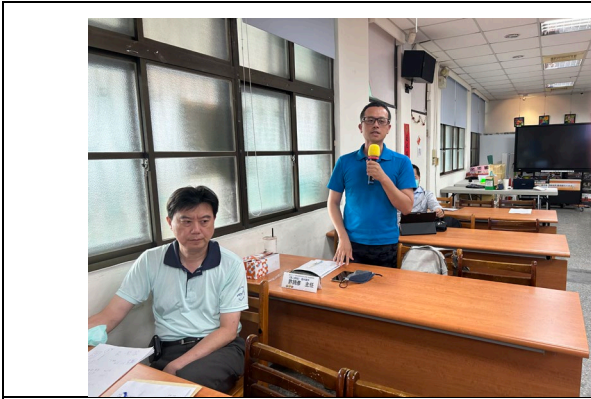
蘭州提出臨時動議討論。