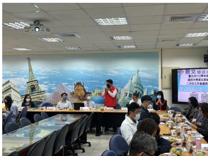
景文高中江校長致詞