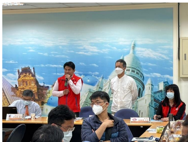
專題講座-議題探究生命教育、戶外教育