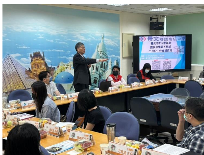
文山區許督學蒞臨指導