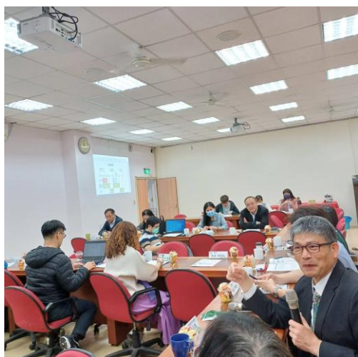
文山區許督學蒞臨指導