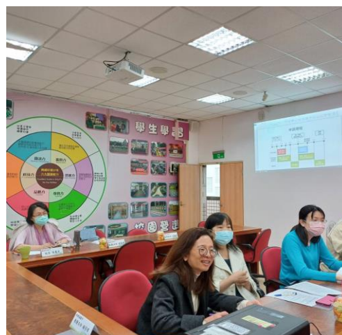
第五群組夥伴與會研習