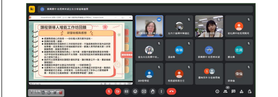
課程領導組期末工作成果分享