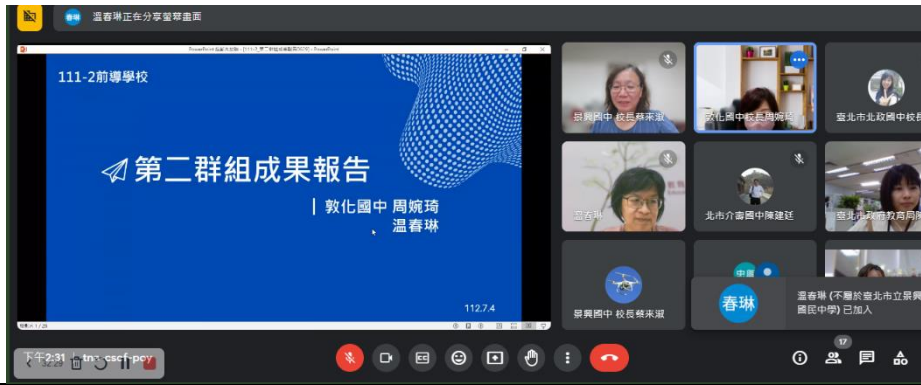
前導第二群組期末工作成果分享