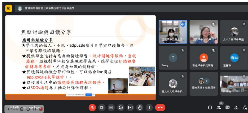
活化推動期末工作成果分享