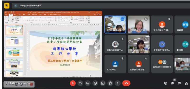
前導第三群組期末工作成果分享