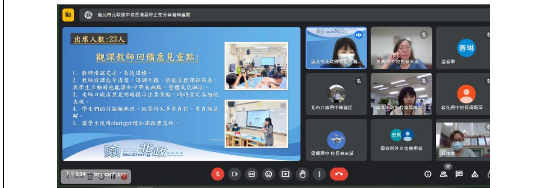
前導第一群組期末工作成果分享