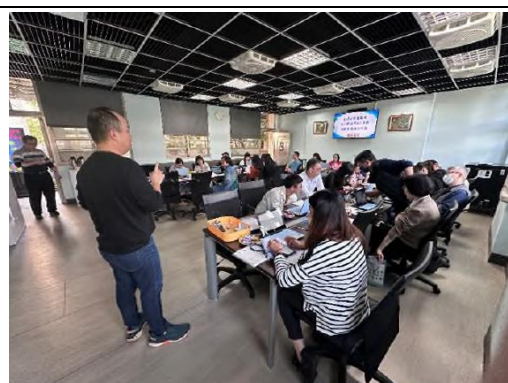
課堂帶領實作簡報