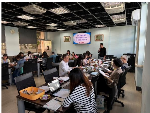
陳 0 主任進行群組業務報告