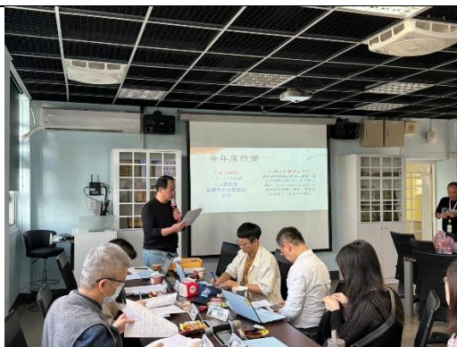
陳 0 主任說明原住民教支人員甄選辦法