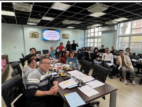
第二群組工作計畫 3 月份會議