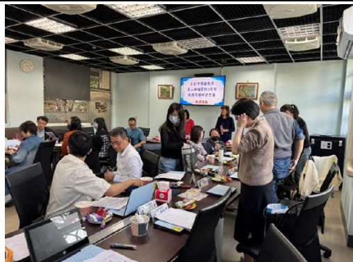
熱烈討論 AI 生成工具