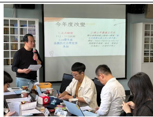
陳 0 主任說明原住民教支人員甄選辦法