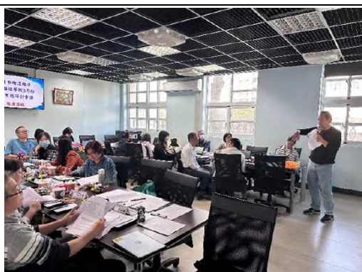
講師深入淺出講解