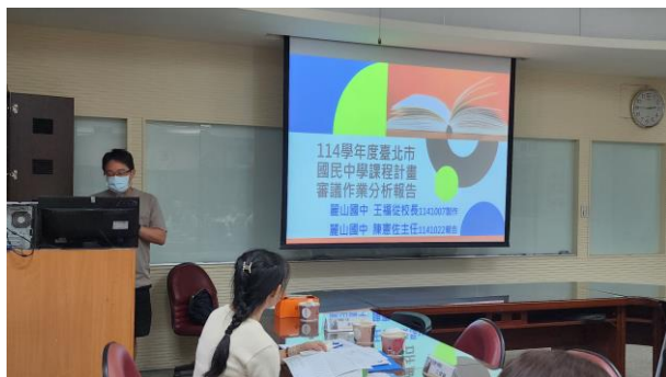
例會主題暨專業分享：114學年度學校 課程計畫審議分析報告