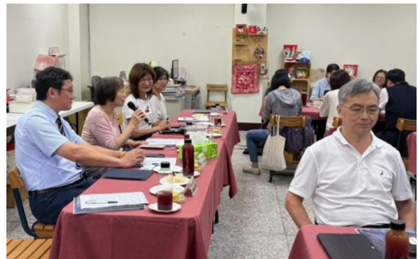
張督學指導及結語