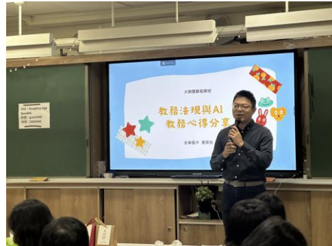
例會主題專業分享