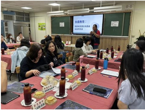
里長分享文山區食農教育