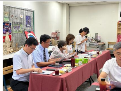
木柵國中方主任業務報告