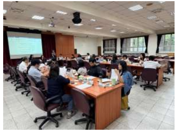
木柵國中柯校長致詞