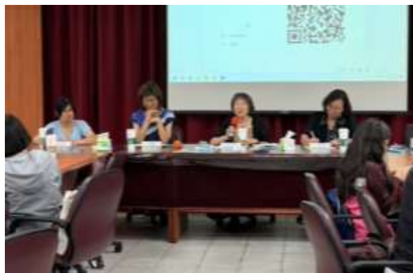
教育局張督學勉勵