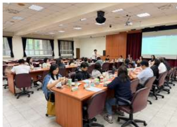
景美國中許校長致詞