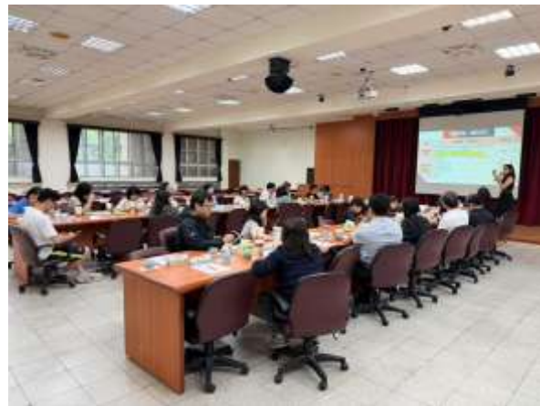
主題講座_課程評鑑實務分享