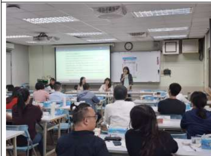
精進教學_聯盟事項宣導