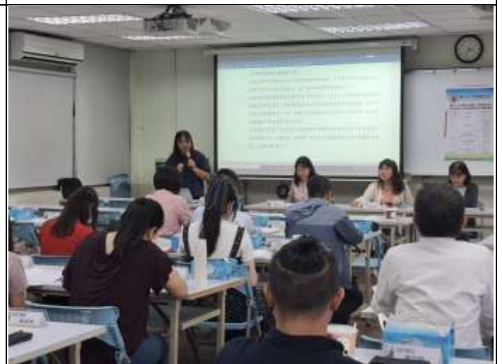
精進教學_聯盟事項宣導