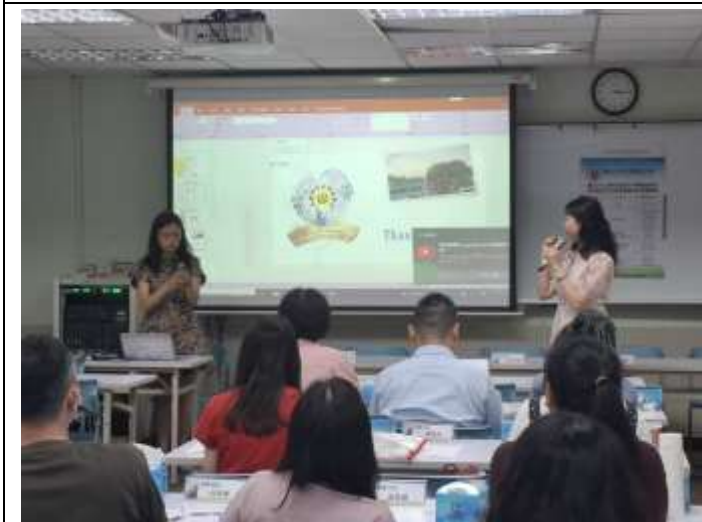
精進教學_專題講座