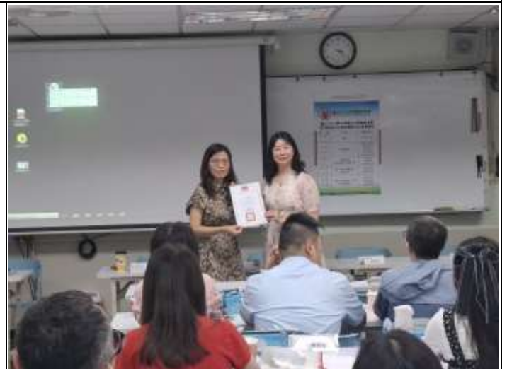
精進教學_致贈感謝狀